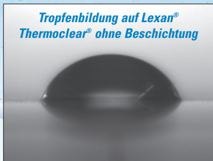
Kontaktwinkel von 66°